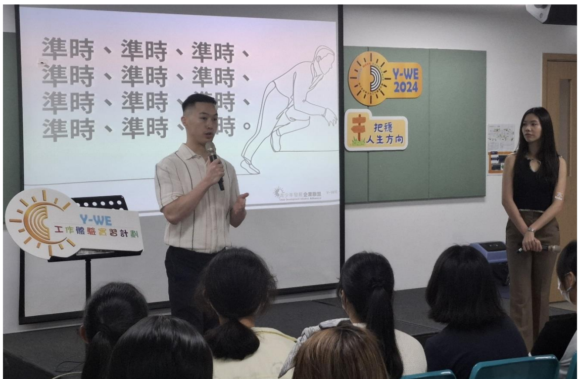
圖 1: 在工作體驗前學員需要面試和接受基礎「打底」培訓，工作體驗後則參加反思會沉澱學習，是一條龍的計劃。