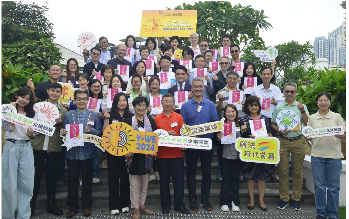
圖 2: 今年共有超過 100 名具社會職場經驗人士擔任義務「職志導師」，作學員的「盲公竹」，在 Y-WE 過程中從旁扶助、指導及支援他們順利完成工作體驗。