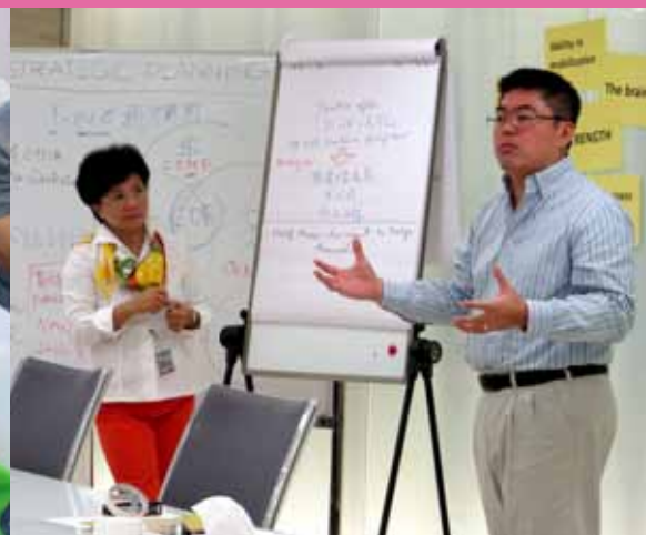
一班「企業聯盟」的董事和成員，在策略定位工作坊上分享他們的真知灼見，交流寶貴經驗，盡心盡力為聯盟工作的方向，出謀獻策，集思廣益，策略定位。