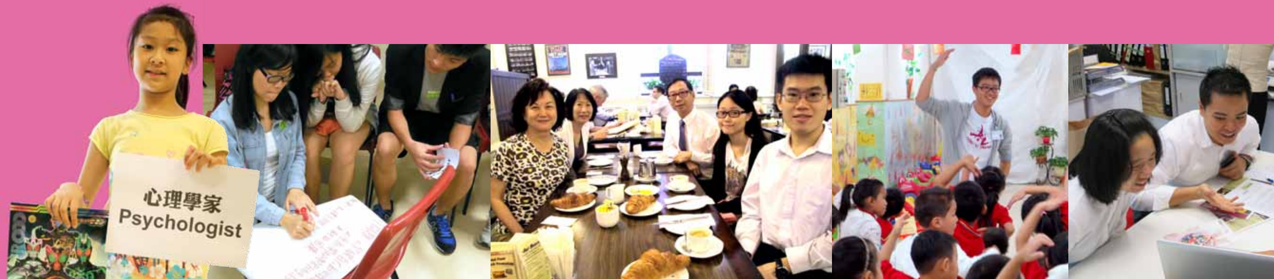
在「腦友體驗營」中，一群兒童發展基金的青少年通過與中風病友的接觸，分享病友患病和康復經歷後，對醫療護理界所涵蓋的各行各業，大開眼界。