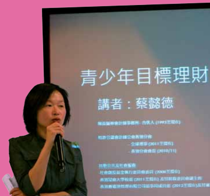
今個暑假，企業聯盟夥拍ACCA，為一班基層家長與青少年舉辦學習理財講座，參加者眾。