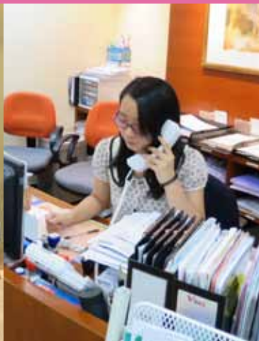
錦雲在聯合醫務保健集團的醫務所工作，跟隨藥劑師學習藥物採購工作的每項細節。認識醫療行業的各種專業。