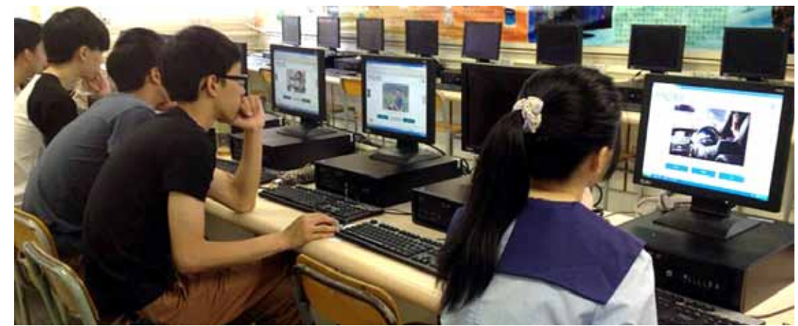
今年參加企業聯盟「Y-WE我才有用」工作體驗計劃中的基層青少年被安排進行「潛能測試」，發掘他們的興趣傾向。兩個多小時的互動測試過程，輕鬆有趣。

時顯示她的興趣傾向於人文科學，未來的工作定向是社會服務一類的行業。測驗後她被安排到我們的辦事處，實行兩周的工作體驗，這時剛在中學文憑試放榜後，她果然報讀了城大的人文科學。在工作中她表現得十分主動積極，與同事建立了良好的人際關係。在一次討論如何開展某項全新的工作時，她更提出了很好的意見。她的表現令大家深受鼓舞。